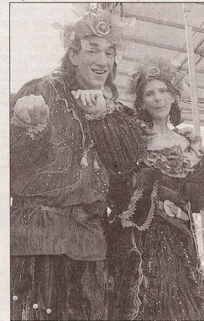
Les Zicotins sur échasses ont animé avec d'autres la soirée.

► Du matos ! Sur un chiffre d'affaires entre 500 000 et 700 000 euros, l'investissement en matériel est lourd. Les nouveautés : le numérique et les LED. Le laser avec infographie est très performant. Car podium (45 m 2 et 65m 2 ), scène mobile (80 m 2 ) et pyramide sont adaptés aux courses cyclistes, festivals. Avec un diplôme qualité d'artisan Polygone ajoute à son offre de prestations, qui reste la dominante de son activité, celle de l'installation et de la vente (produits RCF). Lors des deux soirées d'anniversaire, du matériel était proposé à la vente et un tirage au sort offrait un casque Sennheiser.